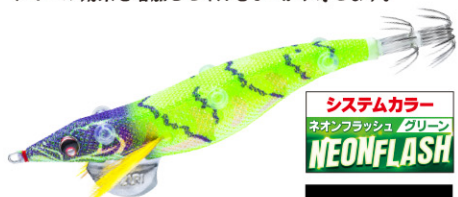
NLM にごりライム 23

紫外線が届きにくい濁り潮の状況でも、 ボディ本体のチャート系カラーが アピール効果を増加させイカをしっかり寄せます。