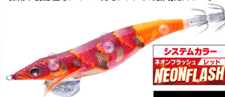
NRBW 藻場ブラウン 25

藻場によく見られるブラウン系の海藻や岩礁に同化。 オレンジのバイトマーカーとネオンフラッシュレッドを 採用し視認性もアピール力もアップした藻場用カラー。