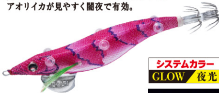
LYR 闇夜ローズ 18

闇夜、曇天の夜など光量が少ない状況での使用に 特化したカラー。レッド下地に赤ベースのカラーは 光が届かない状況でシルエットがハッキリし アオリイカが見やすく闇夜で有効。