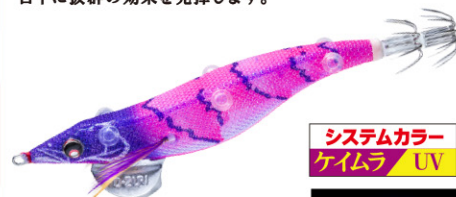
KVVP 日中ピンク 22

実績のあるパープルスポットのピンクボディに ケイラの紫外線発光をプラス。 日中に抜群の効果を発揮します。