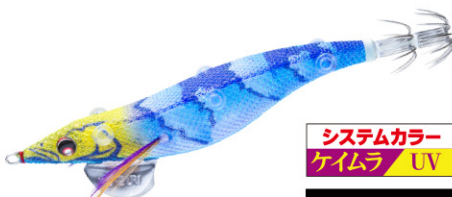
KVSB すみ潮ブルー 21

ケイラ発光+ナチュラルなブルーで澄潮時の 警戒心の強いイカをしっかり抱かせます。