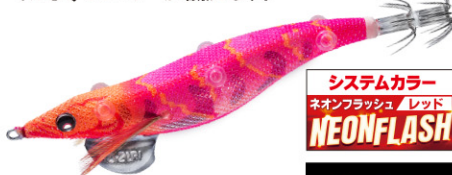
NRDR どんよりレッド 24

紫外線発光しつつシルエットがハッキリする ネオンフラッシュレッドボディ採用。曇天で紫外線が 弱くなった状況でもシルエット効果がプラスされる事により、 イカを寄せるパワーが増加します。