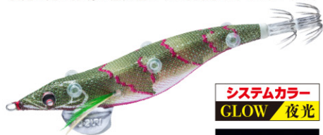
LFM 深場グリーン 17

シルエットがしっかりする赤ベースに ナチュラルなグリーンの組み合わせ。 夜光の光で深場の低活性のイカも反応させてしまいます。