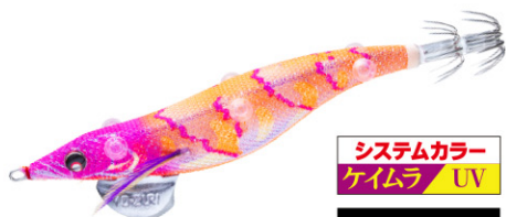
KVMO まづめオレンジ 20

視認性の良いオレンジ+ケイラボディは マズメ時や薄暗い状況下で威力を発揮します。