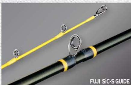
FUJI SIC-S GUIDE

日本最古のアーチ型石橋として知られる、長崎県中島川に架かる「眼鏡橋」の屈強な構造からインスピレーションを得た伊東由樹がメガバスファクトリーチームと共に最新のストロングスピニングシートを生み出しました。さらに進展させた独自のC型アーチ構造を持つブリッジコンストラクションでデザインされたMBCSは、ファストバックするブリッジのリップがパーミングハンドに深くフィット。シャフトの振り抜き方向を正確に保持する精度の高いプレジジョンアングルによるキャストビリティを発揮します。多面Rの融合で構成された独自のカットングデザインが、最小の体積で最大の強度を実現し、操作時にはブランクスシャフトとダイレクトに指がタッチ。リニアな「直感性能」を発揮します。ディーブコンタクトにおける感度の解像度を高めています。