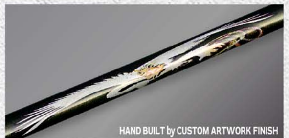
HAND BUILT by CUSTOM ARTWORK FINISH