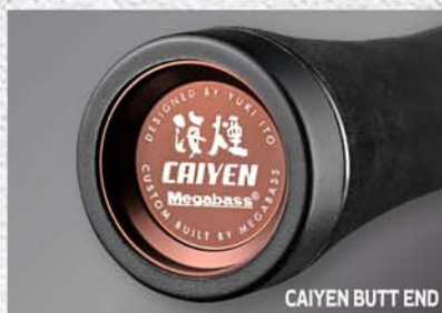
CAIYEN BUTT END