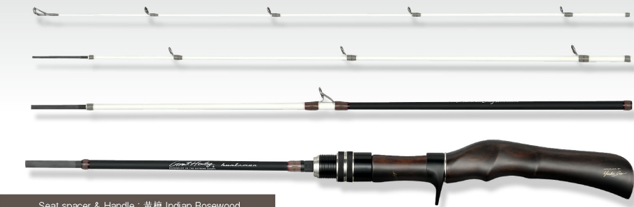
Seat spacer & Handle : 黄檀 Indian Rosewood