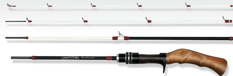
Seat spacer : 黄檀 Indian Rosewood Handle : 白檀 Ivory Rosewood