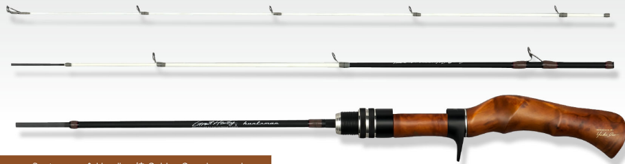
Seat spacer & Handle : 楠 Golden Camphorwood