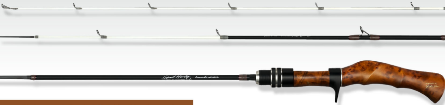
Seat spacer & Handle : 楠 Golden Camphorwood