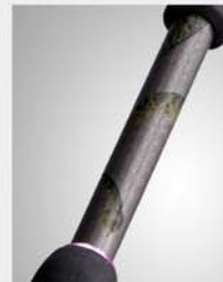
DNA TITANIUM RARE METAL GRAPHITE Composite GRACOMPO™ FRAME SYSTEM (PAT.)