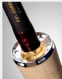
Head Locking Bezel (PAT.)