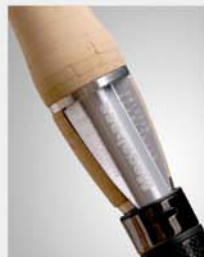
ISFH Spinning Reel Mount (PAT.P) (ITO STEALTH FIT HOUSING)