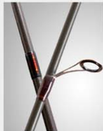
■Fuji-SiC Guides : Titanium Frame ■Thread color ■Base : See-through Deep Rich Brown ■Trim(Outside) : Metallic Copper ■Trim(Inner) : Metallic Cherry Red