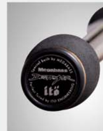
Butt end/Balancing plate