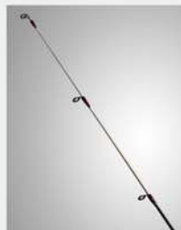
HEDGEHOG Stinger Tip (1piece Tubular)