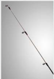
HEDGEHOG Stinger Tip

高音質マフラーや管楽器が、パイプ内空洞空間の確保に腐心する様に、細い小径ブランク独自では共振空間が確保できないため、振動が減衰してアングラーに伝わりがちです。しかし、デストロイヤー・ヘッジホッグは、リールシートからグリップエンドまで貫通する大口径のパイプフレームが振動空間を確保。そこに細軸のヘッジホッグブランクを結合する特殊な構造です。「響く振動」をスピニングロッドで体感するための設計です。