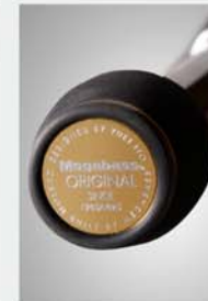
Butt end/Balancing plate