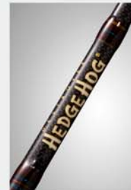
Airtech Hi-10X FEEL Graphite Blank