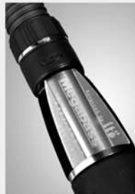
ISFH Spinning Reel Mount (PAT.P) (ITO STEALTH FIT HOUSING)