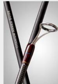
■Fuji-SiC Guides Titanium Armed Guide Frame ■Thread color UVA PASSA(DARK BORDEAUX) ADRIA BLUE