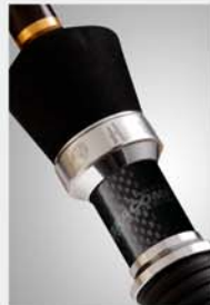
Gracompo Frame (PAT.)