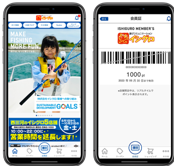
図1 『釣具のイシグロ メンバーズアプリ』アイコンとトップ/会員証画面